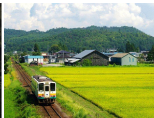
山形鉄道 フラワー長井線 夏