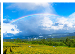
白鷹町 中山大紅花畑