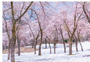
小国町 梅花皮花の残雪桜