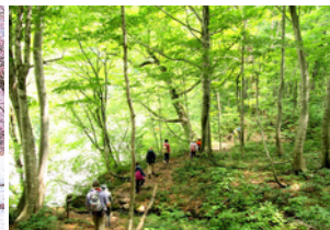
小国町 森林セラピー基地 プナの森温身平