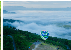
南陽市 十分一山 雲海気球フライト体験