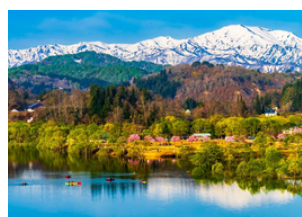
飯豊町 白川湖の水没林とカヌー

アルカディアエリアの絶景を眺めながら、 あなたのとおきおきの場所で、 郷山のごっつおを楽しんでいかがでしょうか。