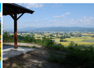
飯豊町 ホトケヤマ散居集落展望台からの田園散居集落景観