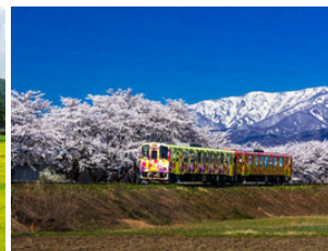
山形鉄道 フラワー長井線 春